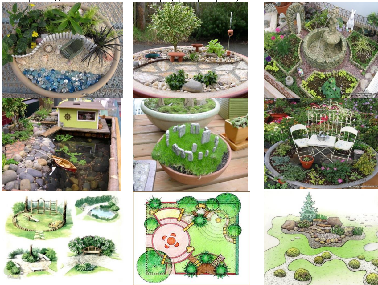
Рис 1. Пример проектов «Садовая миниатюра»

В бюро ландшафтного – дизайна «Творческая мастерская» поступил заказ на разработку экспозиции к выставке «Ландшафтный дизайн: традиции, новации, перспективы», в разделе «Садовая миниатюра». Разработки должны представлять полноценный реализованный проект ландшафтного дизайна, только в миниатюре (пример на рис.1).