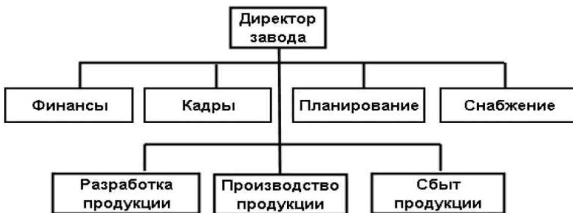
Рисунок 1. Структура управления

Необходимо заполнить пустые графы. При этом необходимо учитывать, что в каждой графе может быть более одного варианта.