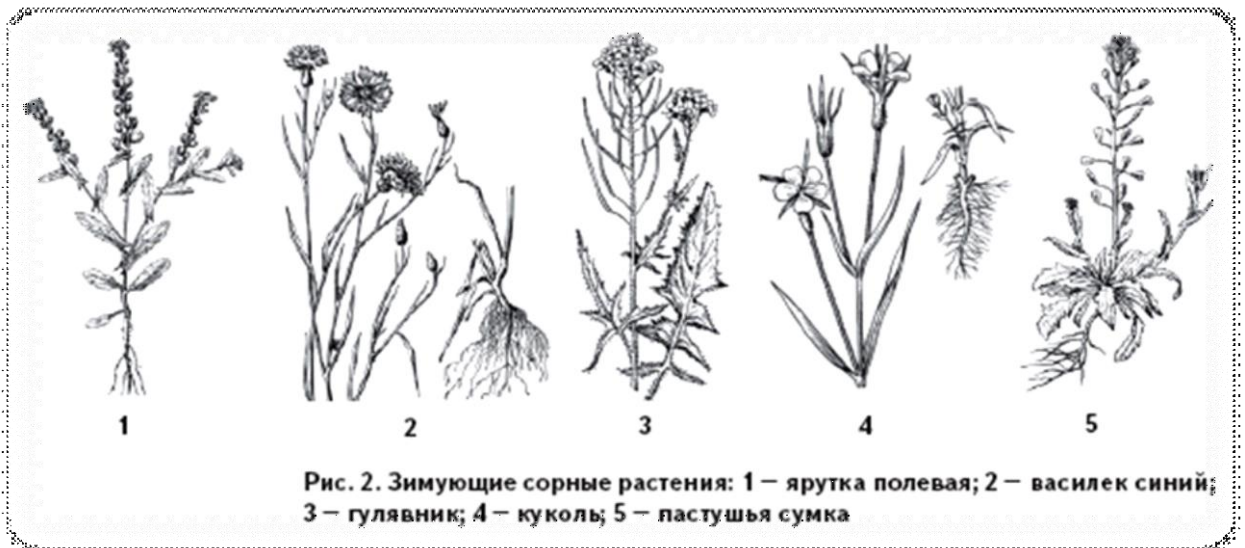
Рис. 2. Зимующие сорные растения: 1 — ярутка полевая; 2 — василек синий; 3 — гулявник; 4 — куколь; 5 — пастушья сумка