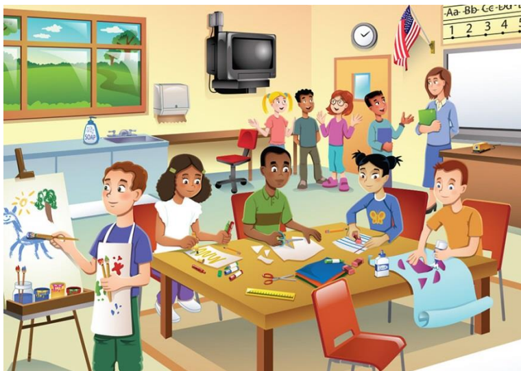
Контрольная работа 4.