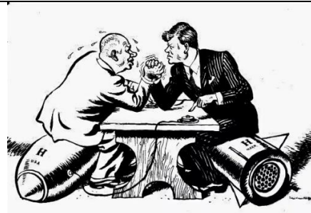
Британская карикатура на Карибский кризис