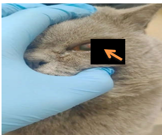
Рисунок 2. Конъюнктивит у кота, порода британская короткошерстная, возраст 4 года: воспаление слизистой оболочки глаза